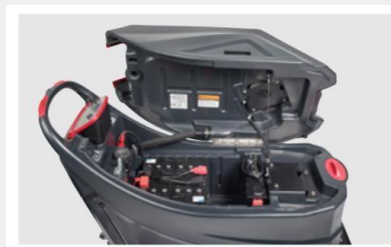
Depósito de recuperación con asa para facilitar la inclinación

La AS 7690T prioriza el rendimiento inteligente, el diseño sencillo, facilidad de uso en zonas de superficies medianas y grandes.